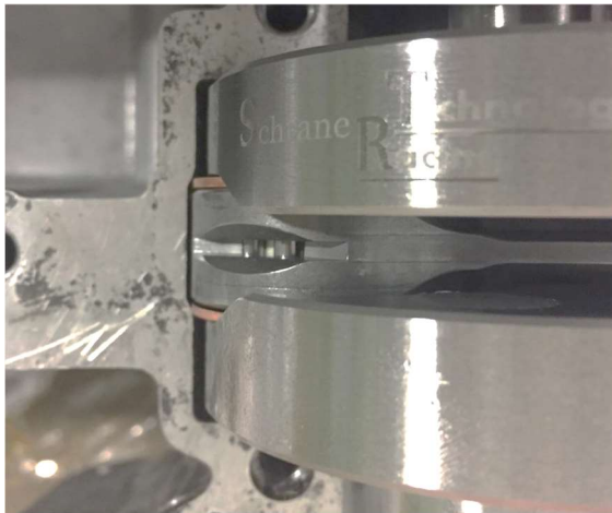
Abbildung 1: Kurbelwelle steht im Bereich des Pleuels am Motorgehäuse an